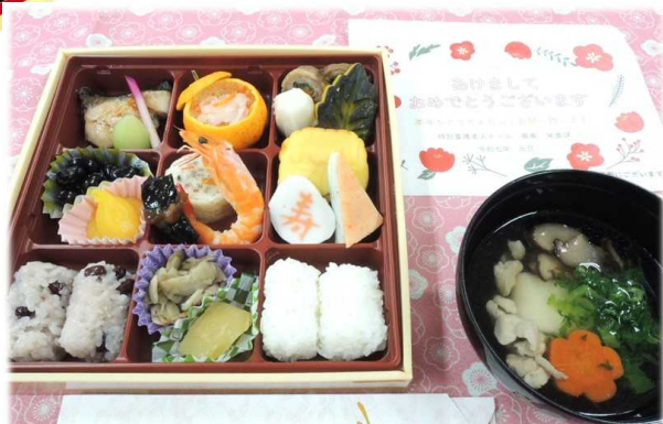
令和7年1月1日 おせち (普通食)