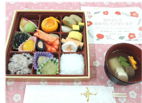
1月1日 おせち (ムース食)